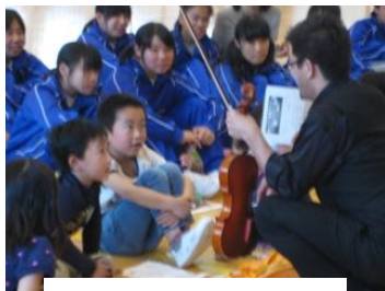
バイオリンの紹介

6月13日のオーケストラ本公演への興味が高まり、聴くだけで無くオーケストラに合わせて合唱で参加するという意識を高めることができました。