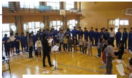
「ビリーブ」の合唱練習