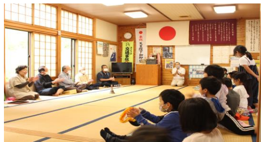
上野平地区の方々へ昔の学校の様子を尋ねる児童

名所を巡りながら、大久保、上野平、大河内地区にお伺いし、地域の歴史や当時の学校の様子を学んでいます。初めて知ったことや驚きがあり、子供たちはあらためてふるさとのよさを感じました。