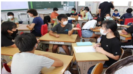
森小で授業に臨む児童

本年度、初回の3小交流活動を実施しました。授業に参加したり、昼休みを過ごしたりと、始めは緊張していた様子でしたが、友達との関わりが以前より増え、楽しさを感じることができました。