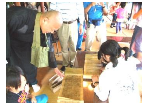
蔵泉寺大般若見学

大久保地区の皆さんを始めとして、協力いただいた皆さんのおかげで、楽しい宿泊体験となりました。ありがとうございました。