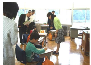
1年国語の授業風景