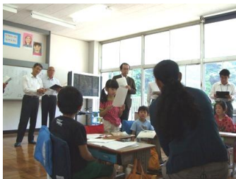
2年国語の授業風景

・たくさんの来訪者の前でも、堂々と発表したり、集中して課題に取り組んだりしているのはすばらしいです。