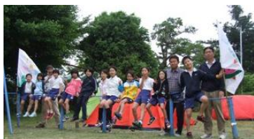
テントをバックに全員写真